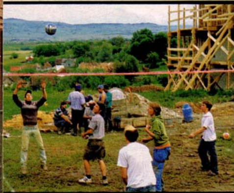
Besser als Fernsehen: Fasziniert beobachten Roma-Kinder die deutschen Gäste beim Zementanrühren oder Volleyball-Match