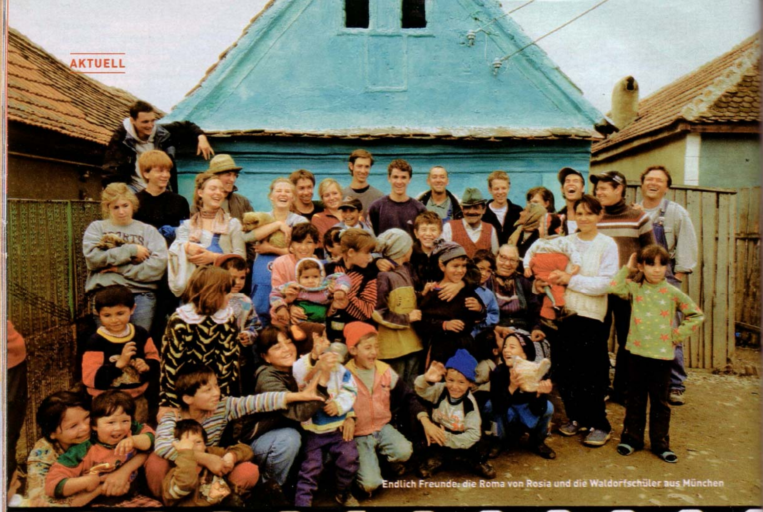
Endlich Freunde: die Roma von Rosia und die Waldorfschüler aus München